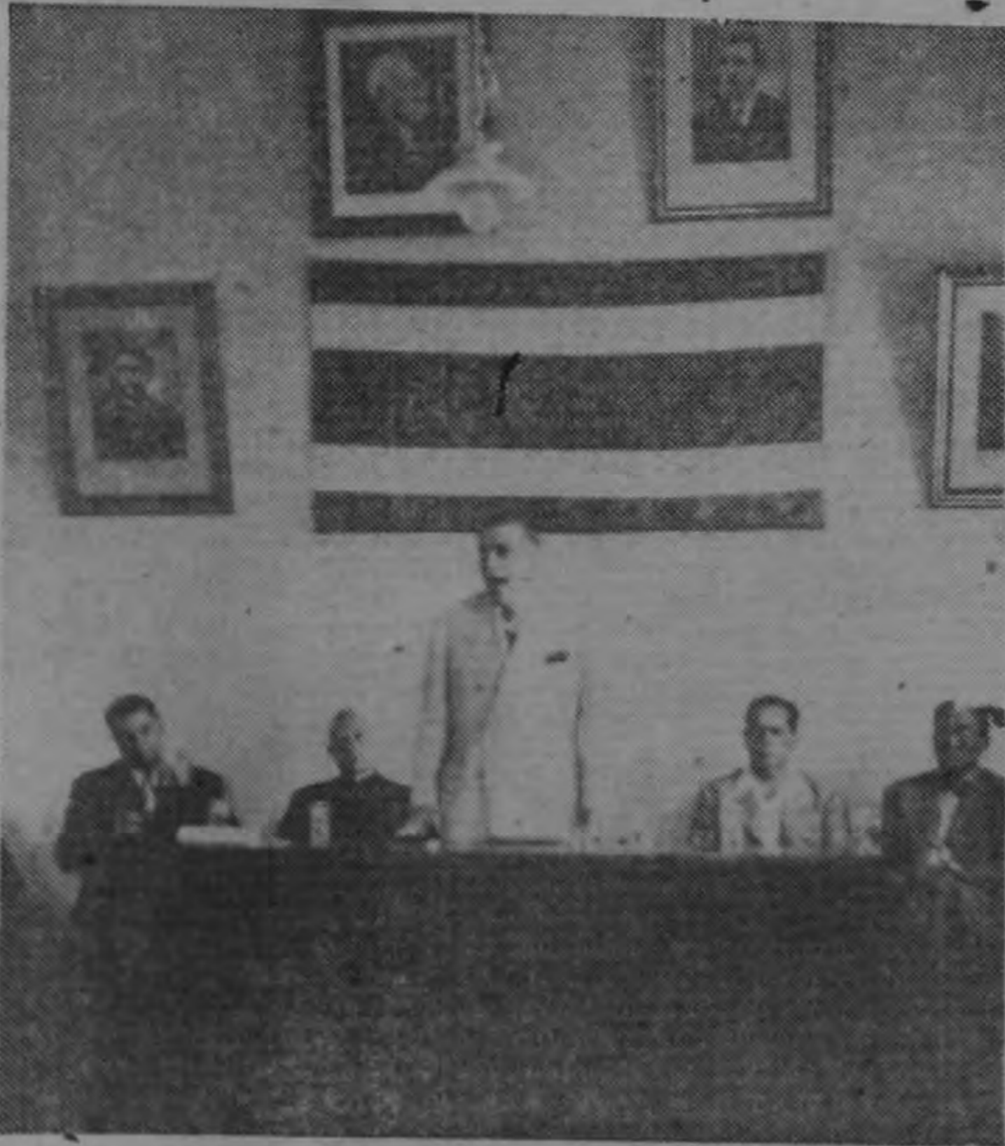
La Municipalidad de Montes de Oca, escucha las palabras del Presidente Ulate, que entregó el domingo los materiales para la nueva cañería del cantón.