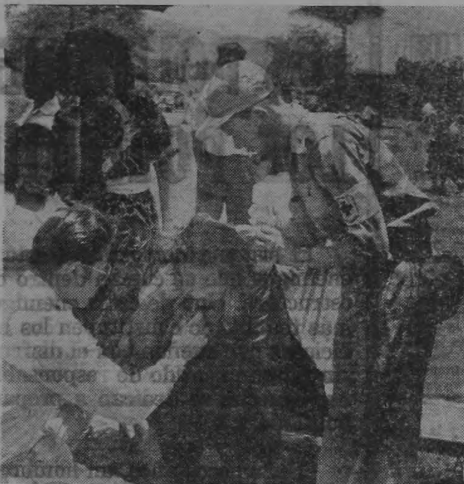
En un parque público, voluntarios de la Cruz Roja atienden a una señora que sufre insolación, en un día de festividad popular

En cuanto a los donadores de sangre, se prestan a todos los exámenes y análisis y están listos para acudir cuando son requeridos.