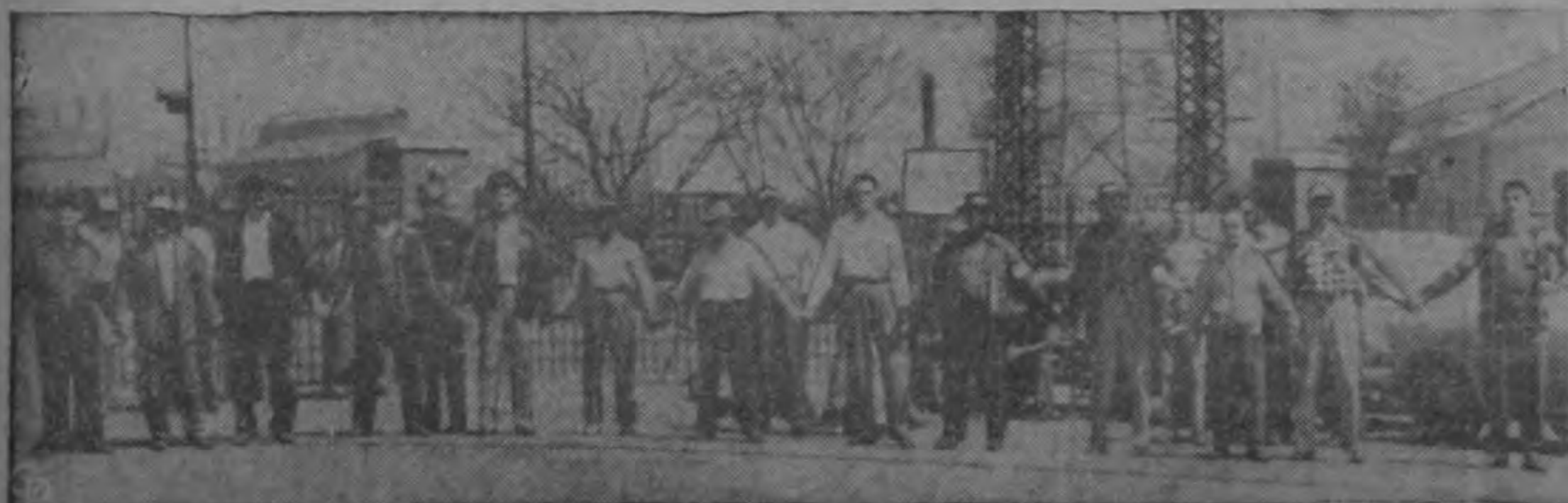
Un grupo de rondistas, tomándose de las manos, forma una cadena humana frente a la fábrica principal de la U. S. Steel Co., en Gary, Indiana. Los rondistas tratan de impedir