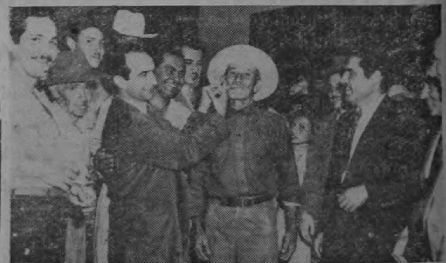
Durante su reciente visita a Santa Ana, uno de los ciudadanos que saludaron a don José Figueres, fué este venerable patriarca de largos bigotes a la antigua, cuya longitud tuvo la curiosidad el señor Figueres de medir.