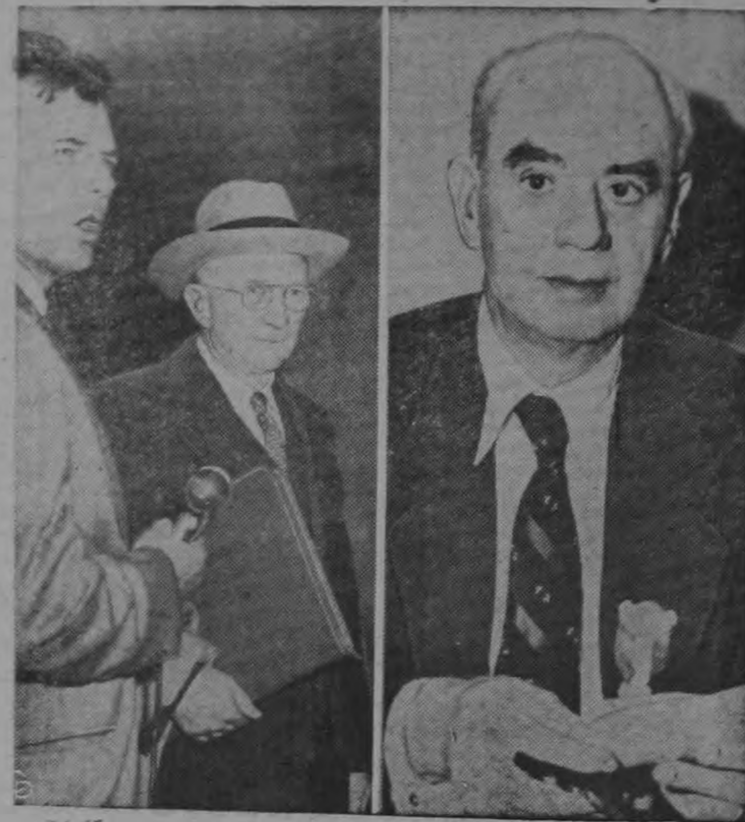
El Juez Federal David A. Pine (con la cartera bajo el brazo) dice en Washington a los periodistas que no tiene comentarios que hacer, después de dictaminar que el Presidente Truman procedió ilegalmente al ocupar la industria del acero. En Cleveland, en rueda de periodistas, el Presidente del Congreso de Organizaciones Industriales (CIO), Philip Murray (derecha) anuncia que los 600.000 obreros del acero "no tienen contrato y por consiguiente no les queda otra alternativa que dejar de trabajar".